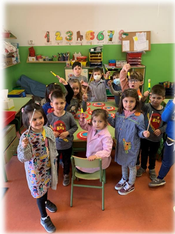
TALLER DE ESCUDOS