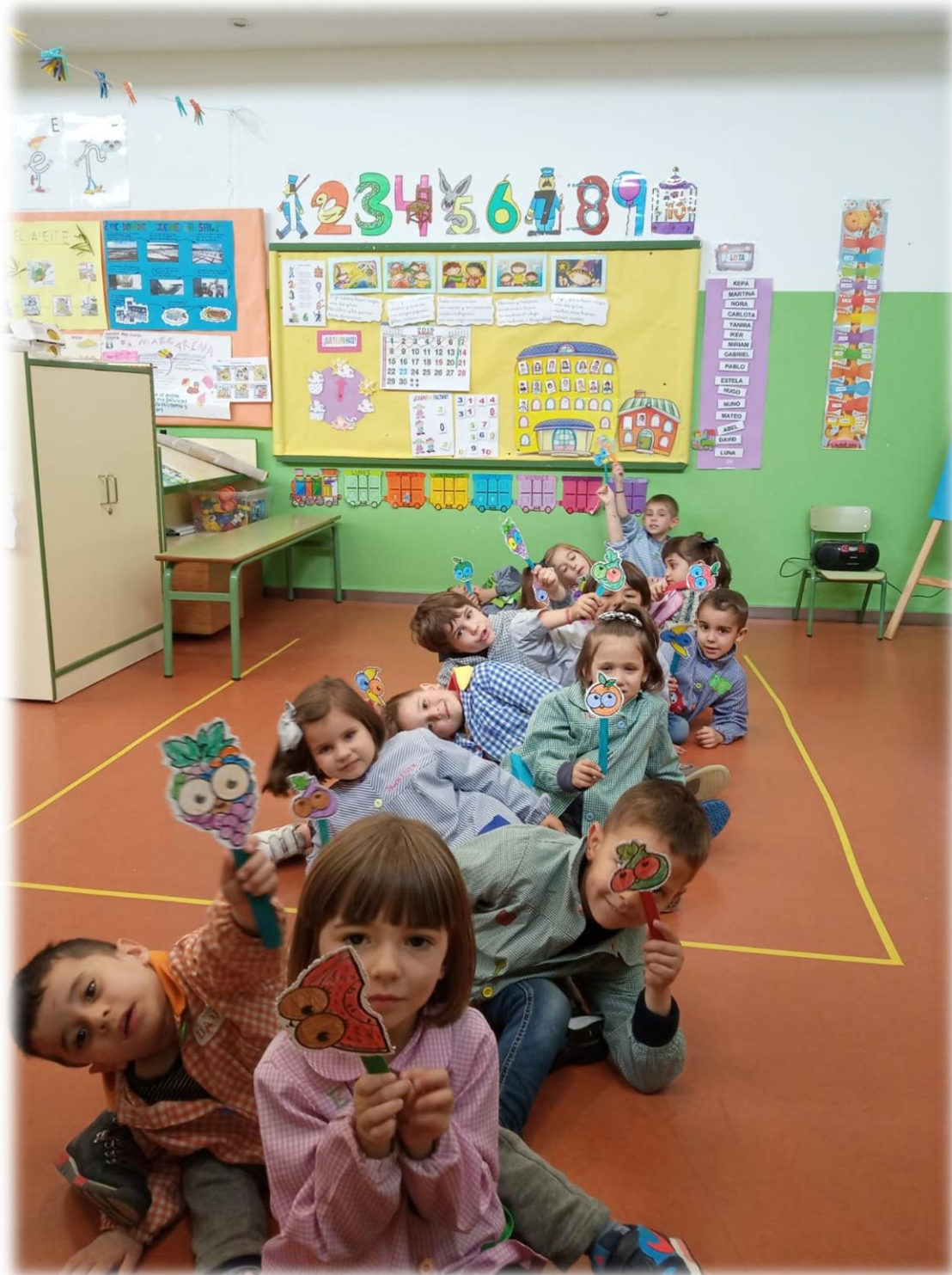
Coloreamos y picamos una fruta y decoramos el palito.