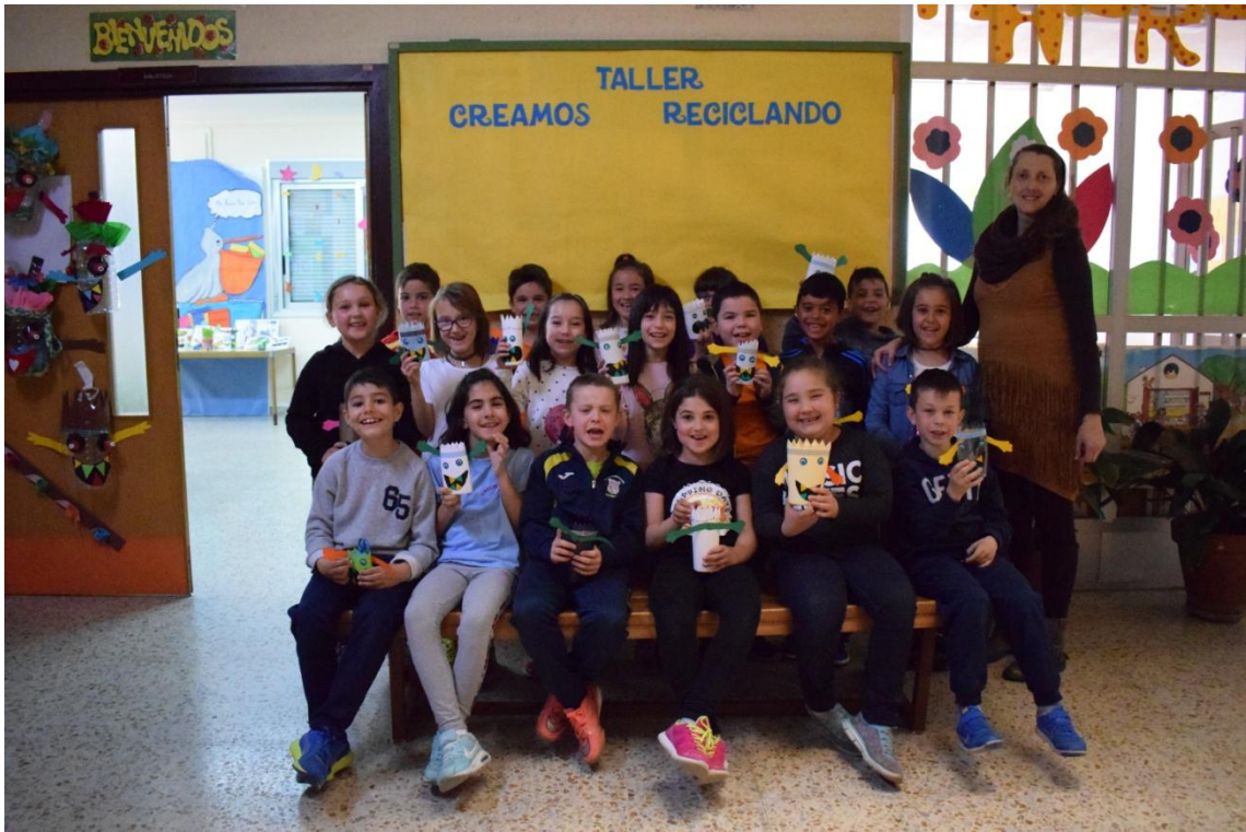
Clase de 2º A