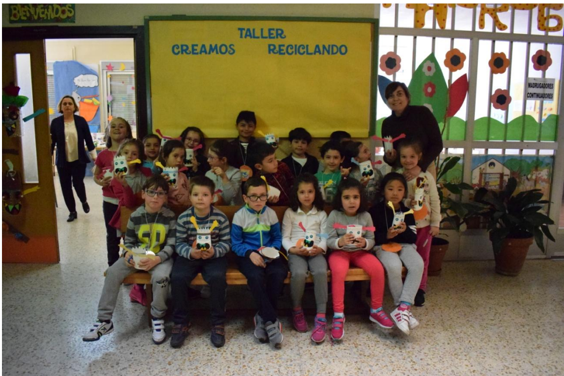
Clase de 1º B