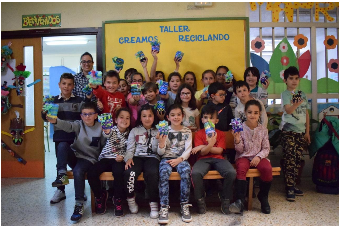
Clase de 3º B