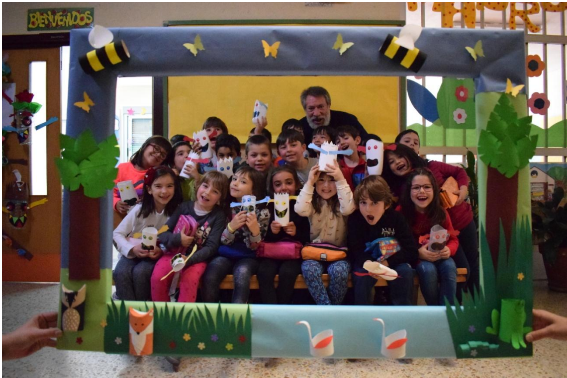
Clase de 1º A