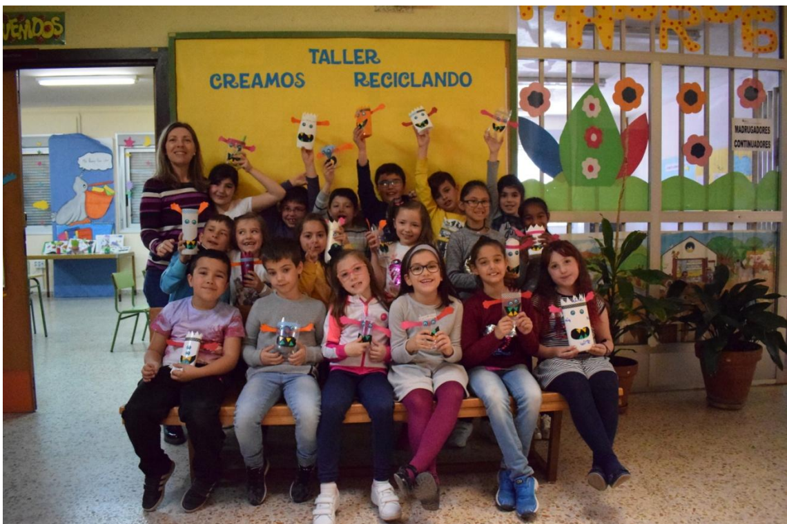
Clase de 2º B