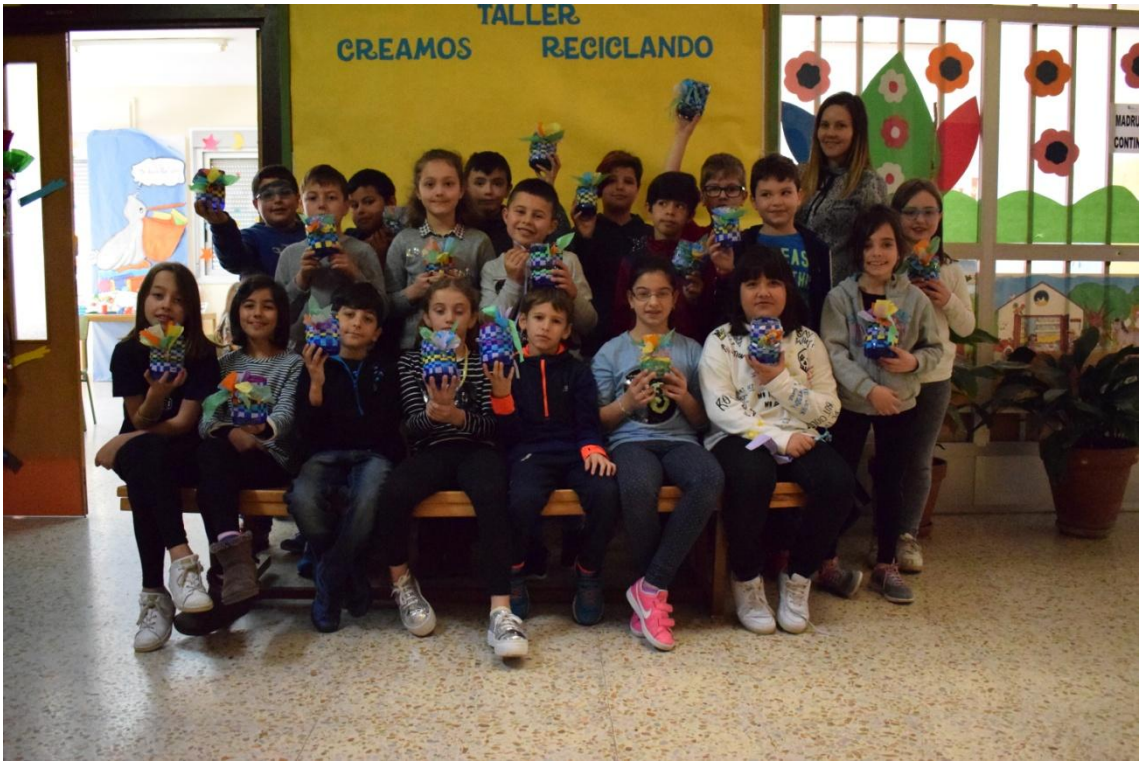
Clase de 3º A